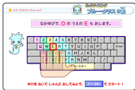
▲ 9級「Eのうちかたとれんしゅう」