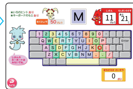
▲ 6級「でたもじのキーをおそう」

すべてのキーをばらばらに打つ練習、「あいうえお」のローマ字のタイピングを学びます。