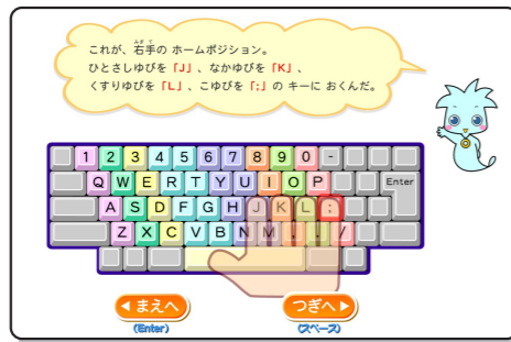
▲ 12級「はじめるまえに」

「ASDFJKL:」の打ち方と、アルファベットの読み方、やさしい英単語を学びます。