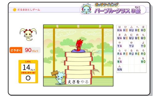
▲ 3級「だるまおとしゲーム」