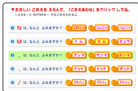
▲ 8級「よみかたのテスト1」