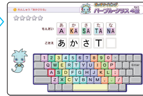
▲ 4級「あかしたな のれんしゅう」