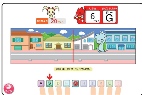
▲ 10級「Gのれんしゅうゲーム」

「GHQWERTYUIOP」の打ち方と、アルファベットの読み方、やさしい英単語を学びます。