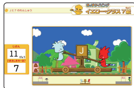
▲ 7級「Jと7のれんしゅうゲーム」