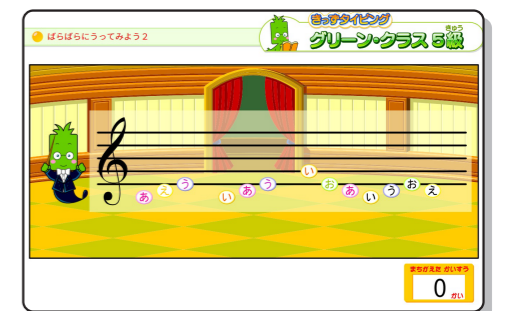
▲ 5級「えんそうゲーム」